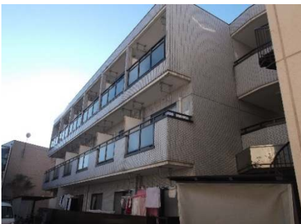
■ 外観写真 ■

お食事券プレゼントキャンペーン中 ご成約の方へお食事券(3,000円分) プレゼント！！